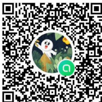
เข้าร่วมกลุ่มไลน์