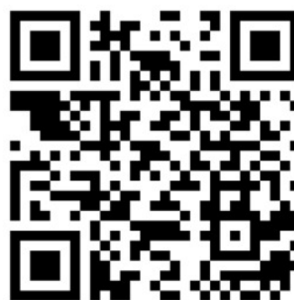
แบบสำรวจข้อมูล