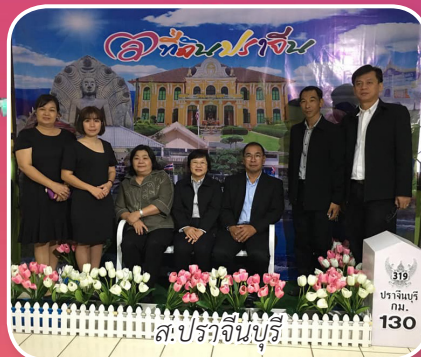
ส.ปราจีนบุรี