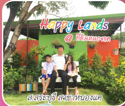
ส.สระบุรี สาขาหนองแค