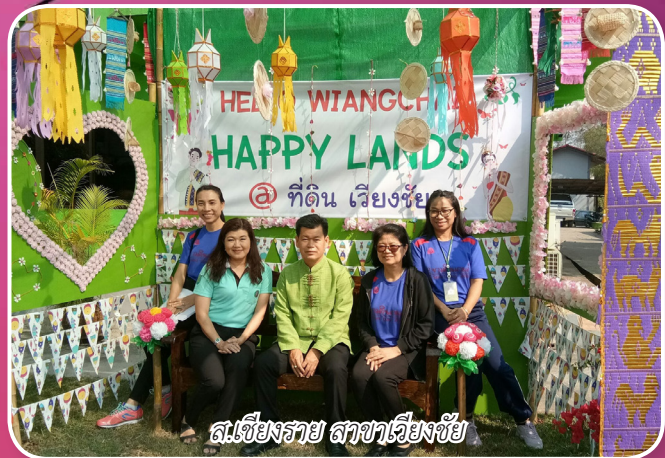
ส.เชียงราย สาขาเชียงใหม่