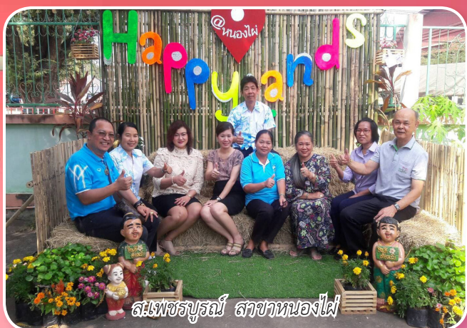
ส.เพชรบูรณ์ สาขาหนองไผ่