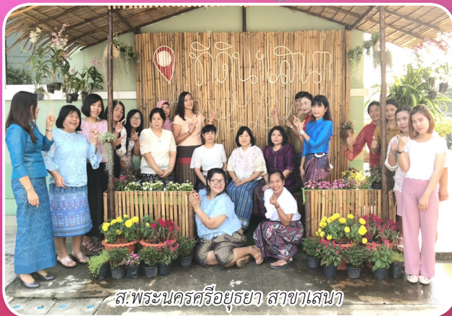
ส.พระนครศรีอยุธยา สาขาเสนา