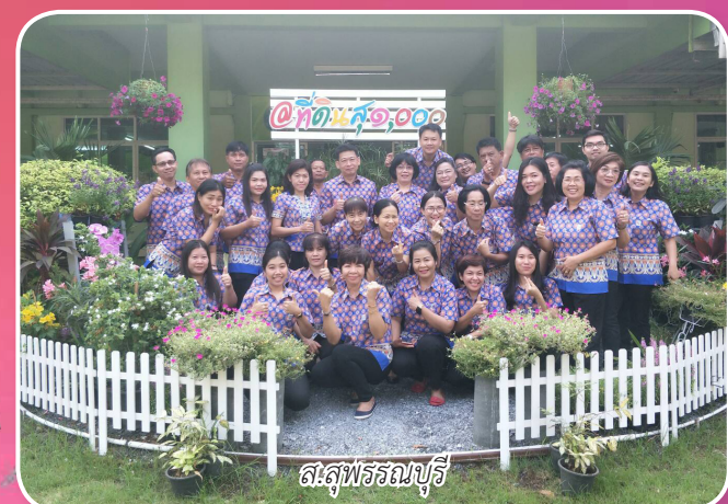
ส.สุพรรณบุรี