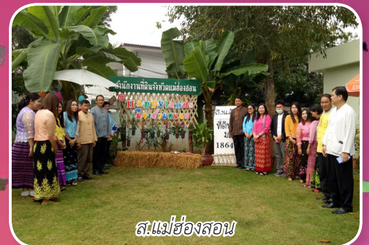
ส.แม่ฮ่องสอน