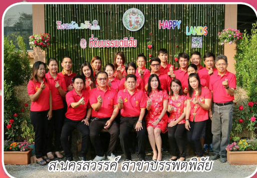
ส.นครสวรรค์ สาขาบรรพตพิสัย