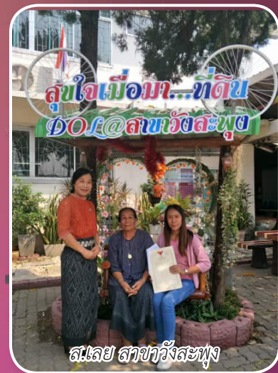
ส.เลย สาขาวังสะพุง