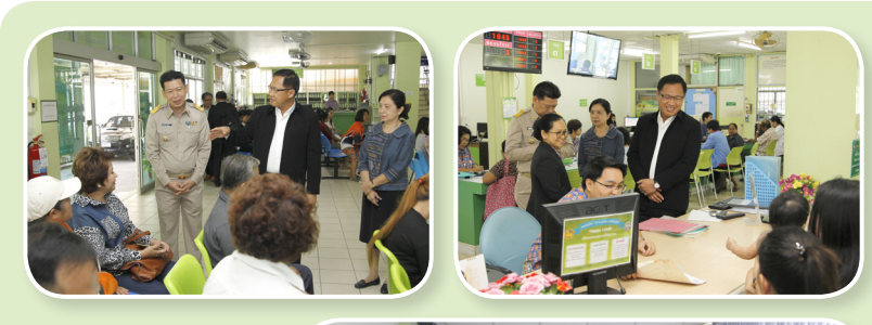
ส.สุพรรณบุรี