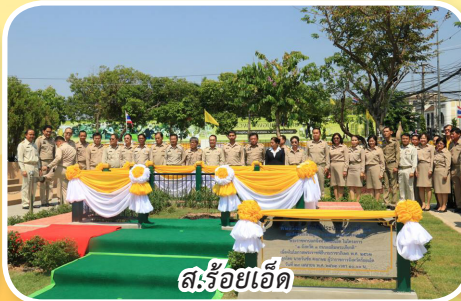
ส.ร้อยเอ็ด