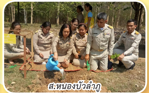
ส.หนองบัวลำภู