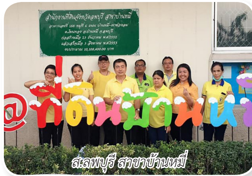
ส.ลพบุรี สาขาบ้านหมี่