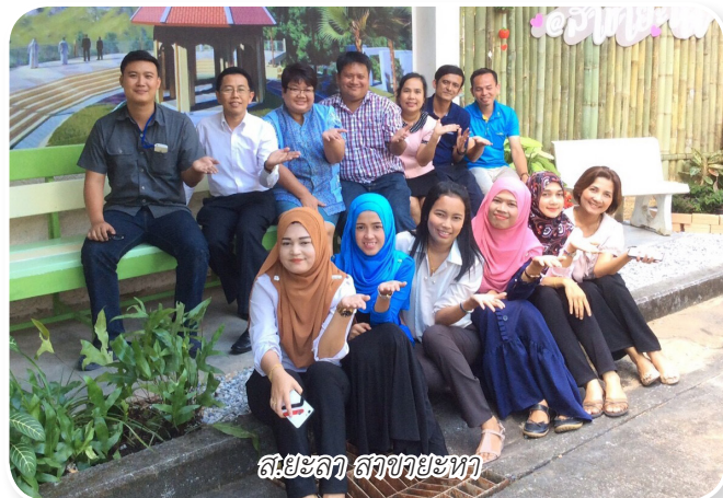
ส.ยะลา สาขายะหา