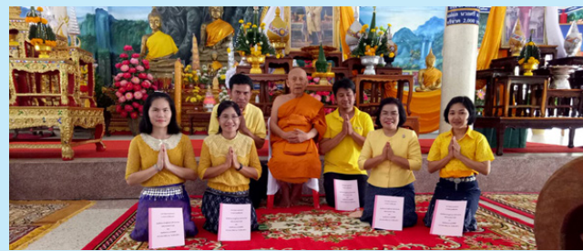
พัชรินทร์ จพต.อุบลราชธานี สาขาเขื่องใน พร้อมชาวดินในสังกัด ร่วมกิจกรรมเจริญพระพุทธมนต์ ถวายพระพรชัยมงคลสมเด็จพระเจ้าอยู่หัวฯ และสมเด็จพระนางเจ้าสิริกิติ์พระบรมราชินีนาถ ในรัชกาลที่ 9