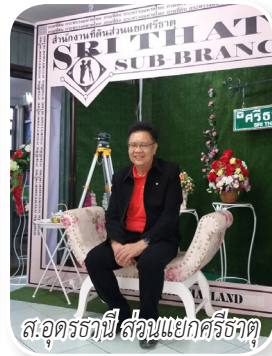
ส.อุดรธานี ส่วนแยกศรีธาตุ