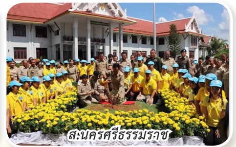
ส.นครศรีธรรมราช