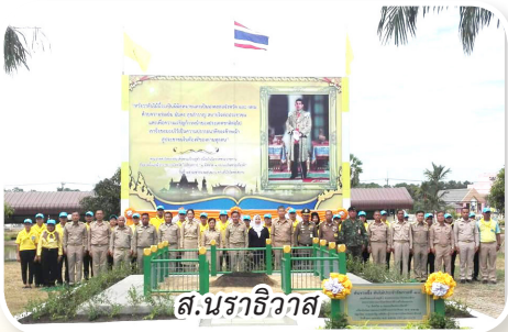
ส.นราธิวาส