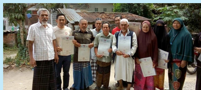
สายสำรวจที่ 5 ศูนย์เดินสำรวจจังหวัดนราธิวาส ปัตตานี ยะลา มอบโฉนดที่ดินให้แก่ประชาชนในพื้นที่บ้านบริจ๊ะ หมู่ที่ 7 ต.ลาโละ อ.รือเสาะ จ.นราธิวาส จำนวน 175 แปลง และมอบโฉนดที่ดินให้องค์การบริหารส่วนตำบลลาโละ จำนวน 1 แปลง