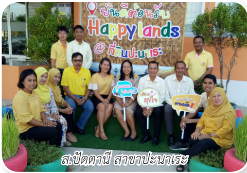
ส.ปัตตานี สาขาปะนาเระ