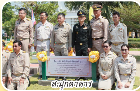
ส.มุกดาหาร