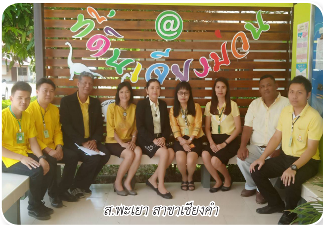
ส.พะเยา สาขาเชียงคำ