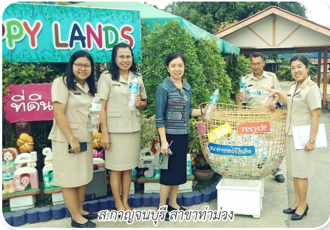
ส.กัญจนบุรี สาขาท่าม่วง