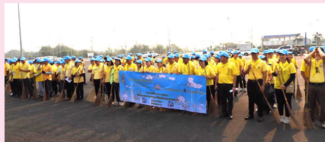
ชาวดินเสริมงาม นำโดยหัวหน้าฝ่ายรังวัด ร่วมทำกิจกรรมโครงการจิตอาสาพระราชทาน “เราทำความ ดี ด้วยหัวใจ” ณ ลานพระบรมราชานุสาวรีย์สมเด็จพระนเรศวรมหาราช นครลำปาง อ.เกาะคา จ.ลำปาง