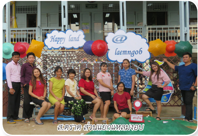
ส.ตราด ส่วนแยกแหลมฉบัง