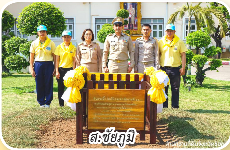
ส.ชัยภูมิ