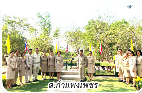
ส.กำแพงเพชร